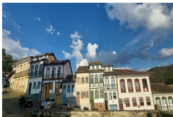
Visita ao centro histórico de Ouro Preto. Autoria: Maria Letícia Ticle Data: 28/05/2024

A equipe do Semente também pôde acompanhar e participar da captura de imagens para a produção de um dos vídeos do projeto - ao todo serão 20 inserções de cerca de 2 minutos nas redes sociais.