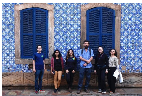
Equipes Semente, A Pique e Instituto Avaliação Autoria: A Pique Data: 28/05/2024